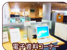
電子資料コーナー

電子資料コーナーの新聞 データベースで記事の検索、 閲覧、複写(有料)を することができます。