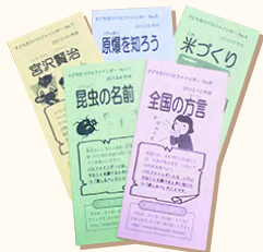
▲子ども向けパスファインダー