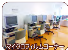
マイクロフィルムコーナー

電子資料コーナーの新聞 データベースで記事の検索、 閲覧、複写(有料)を することができます。