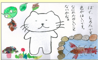
平成28年度子どもの部最優秀賞作品(「ふしぎなボンケーキ」より)