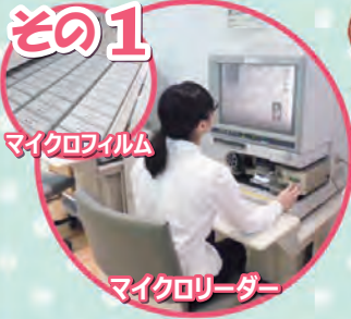
マイクロリーダー