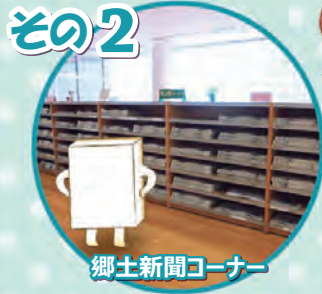
郷土新聞コーナー