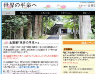
企画展「世界の平泉へ」(2011年8月開催)

デジタル化した上記所収の資料は、普段、保存のため「貴重書庫」と呼ばれる専用耐火書庫に保管されています。