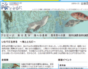
企画展「いわての歴史シリーズ4 海とともに」(2012年2月開催)