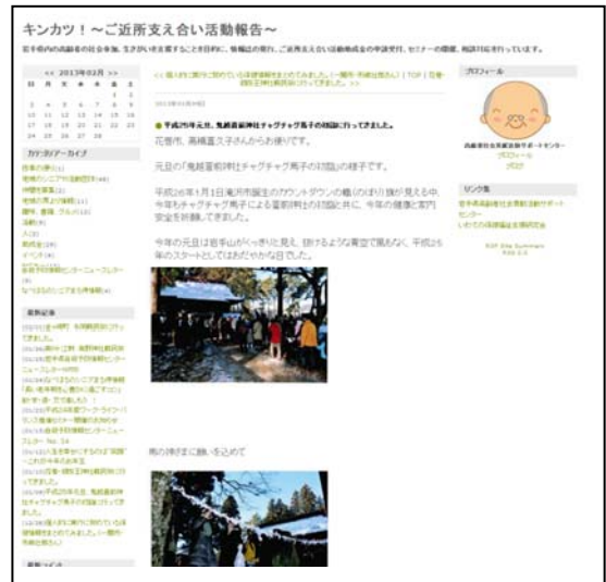
HP内に掲載したシニア通信員からの情報

これまでに寄せられた情報は、風景写真、地元の祭りの様子、震災当時の体験、イベントのお知らせ、書籍紹介などです。