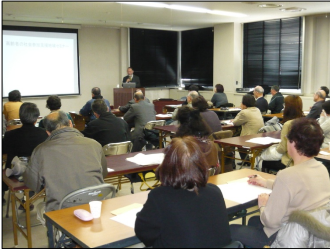
いきいきシニアライフセミナーの様子