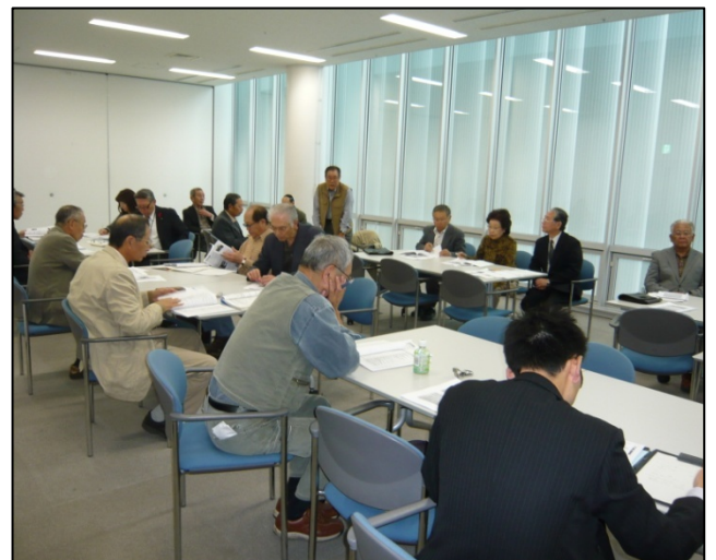
団体交流会・助成金説明会の様子

参加者同士の情報交換のほか、団体結成の相談、団体運営の相談、県内の活動事例紹介、活動資金（助成金）の情報提供を行っています。