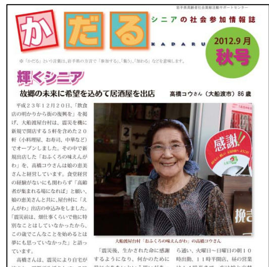
シニアの社会参加情報誌「かだる」

県内で活動するシニア、活動団体、シニアの仲間づくり、その他高齢者に関連した情報を掲載しています。