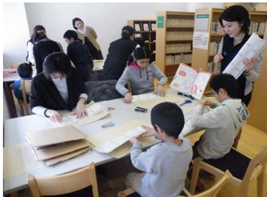
読書ノート作りに親子で挑戦 すてきなノートがたくさんできました

「子ども図書館フェスティバル」では文庫本サイズの本の作り方を学びながら自分だけの「読書ノート」を作りました。