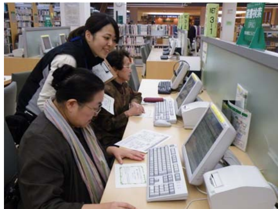
蔵書検索端末の活用法を体験。 ちょっとしたコツでもっと便利に探せます