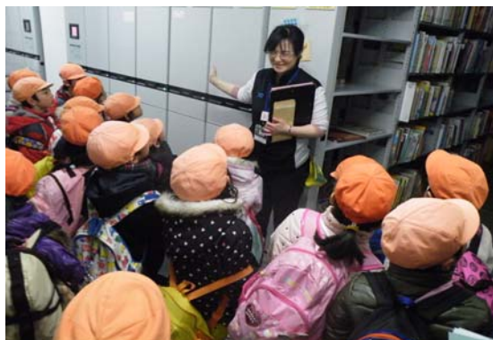
保育園の皆さんと「集密書庫」を探検 図書館のひみつをみつけたかな