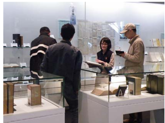
「ギャラリートーク+図書館さんぽ」の日は 企画展の開設と施設見学にご案内します

また企画展の開催期間中には、展示担当者による展示解説と、お客さまからのご質問にもお答えする「ギャラリートーク」をコース