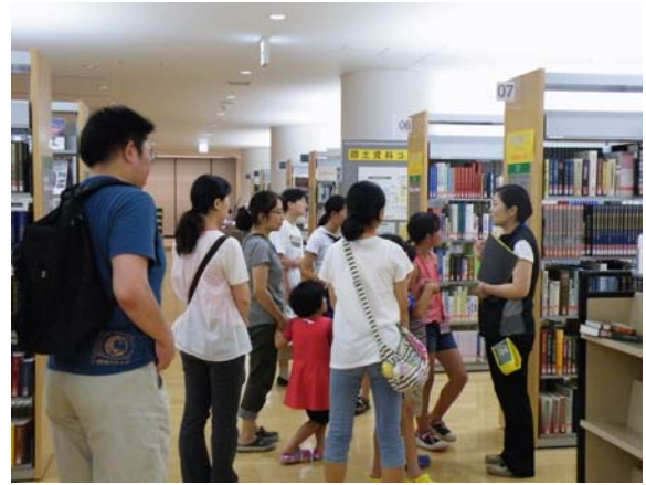
みんなで 図書館さんぽ 「参考図書のコーナー」を探検します

事前申し込み不要で、定期的で開催している「図書館さんぽ」と、学校・保育園・地域の集まり・子ども会・趣味のサークルなど団体で見学でき、ご希望でオリジナルコースを作ることができる「コンシェルジュガイドツアー」があります。